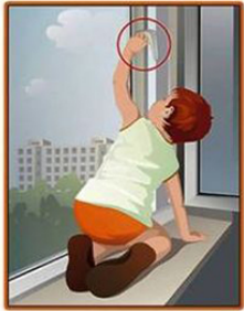
Ребенку хватает всего 30 секунд, чтобы открыть окно